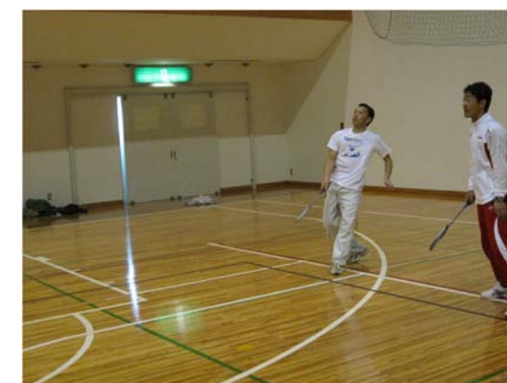
バドミントン 平成22年10月31日