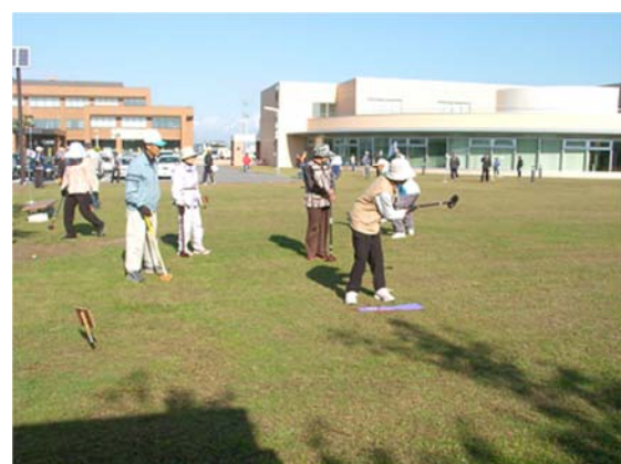
ニチレクボール 平成22年10月16日