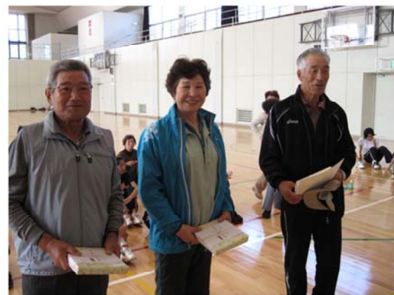
ニチレクボール 平成22年10月16日