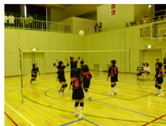
ソフトバレー 平成22年10月24日