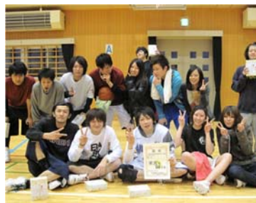
バスケットボール 平成22年12月5日